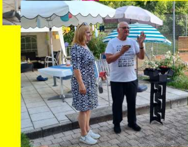
Bouleturnier mit anschließendem zauberhaften Abend